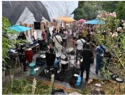
Africa Fête malgré tout et surtout 3ème arrondissement, terre d'accueil pour Africa Fête