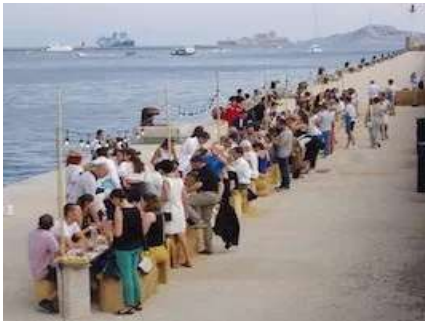
Le bonheur est dans l'assiette ! Dîner insolite sur la digue du large