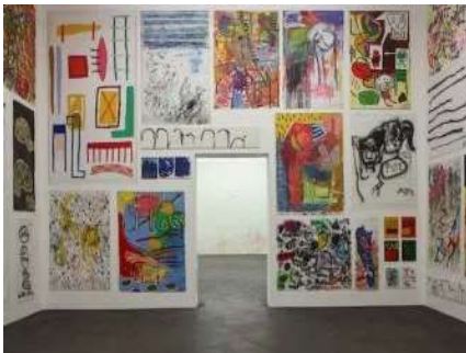
Hors cadre Deux artistes aux pratiques sans frontières sont présentées cet été au Crac de Sète