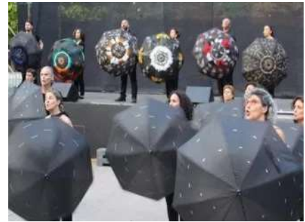
Quand Aix concertise "Aix en juin" prélude au Festival International d'art lyrique