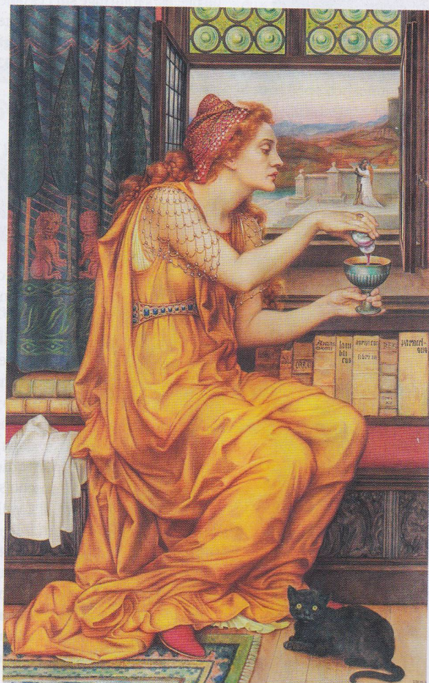
Evelyn De Morgan, The Love Potion , 1903